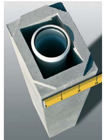
Der Installateur übernimmt den Bau des Brennwert-Schornsteins Skobifix® 30

tigt und werden vor Ort nur mittels Kleber zusammengefügt - Praktisch ein »Legostecksystem«. Das spiegelt sich auch in der sehr kurzen Montagezeit von 2-3 h je